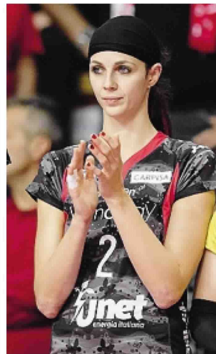
Stufi è ai box per infortunio

Impresa difficile dopo quel che si è visto nel weekend al Pala-Yamay? No, le avversarie